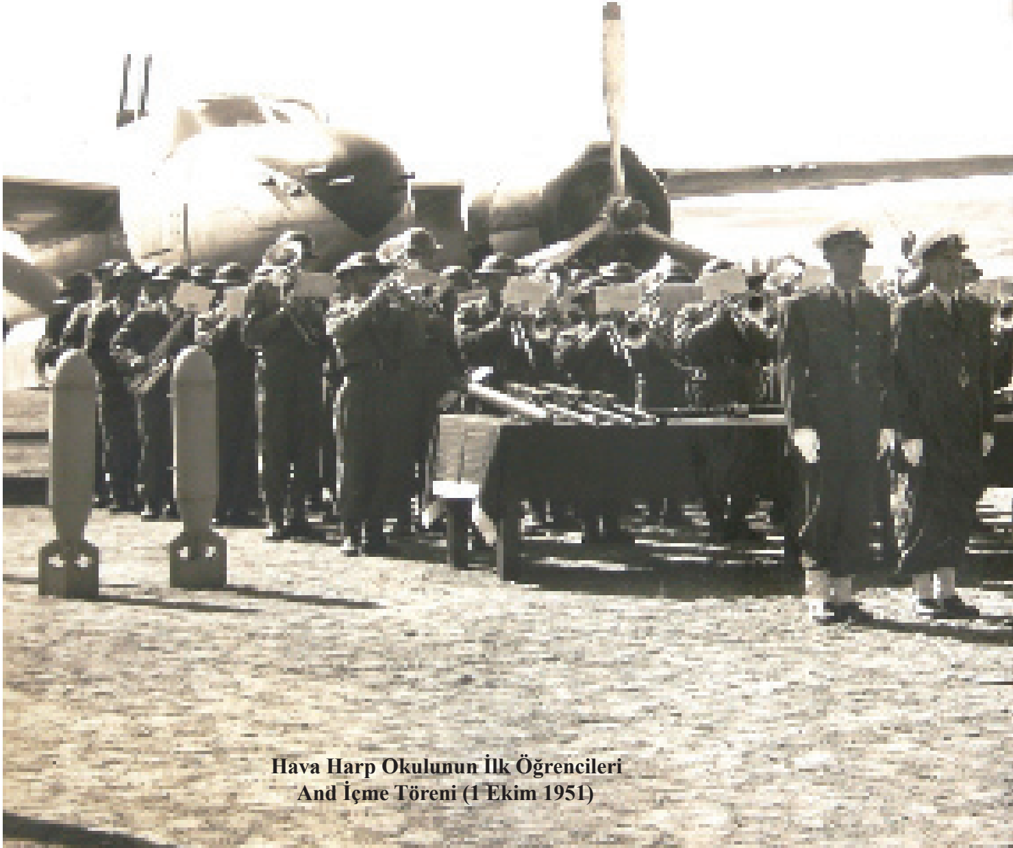
Hava Harp Okulunun İlk Öğrencileri And İçme Töreni (1 Ekim 1951)